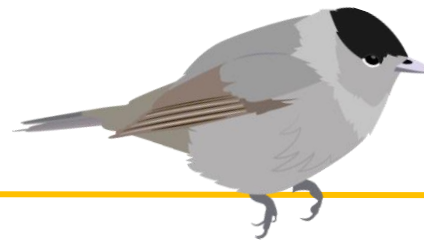
Fauvette à tête noire Nicheuse !