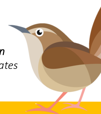
Troglodyte Mignon Présence de sous-strates arbustives !