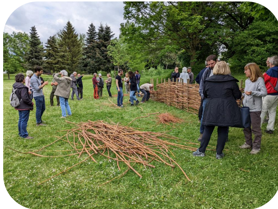
Chantier participatif – création haie sèche