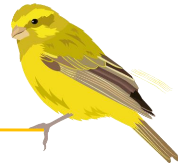
Serin Cini LR France > VU

→ Aucune espèce observée dans notre base de données avant la création du Refuge !