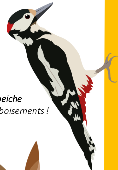
Pic Epeiche Présence de boisements !